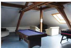
Local de Malleray Grand-Rue 54