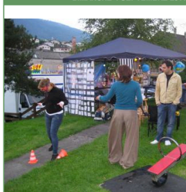
TABLE RONDE MERCREDI 14 SEPTEMBRE 2011

STAND DE PRÉVENTION À LA FOIRE DE CHAINDON DIMANCHE 4 SEPTEMBRE 2011