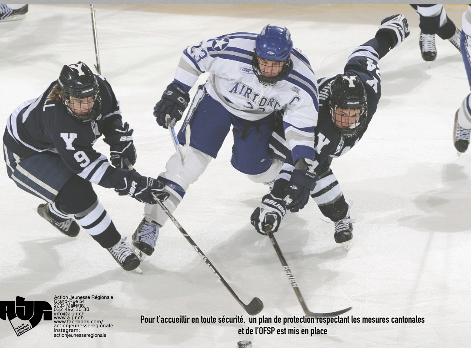
Image libre de droit et gratuite tirée du site : https://www.pexels.com